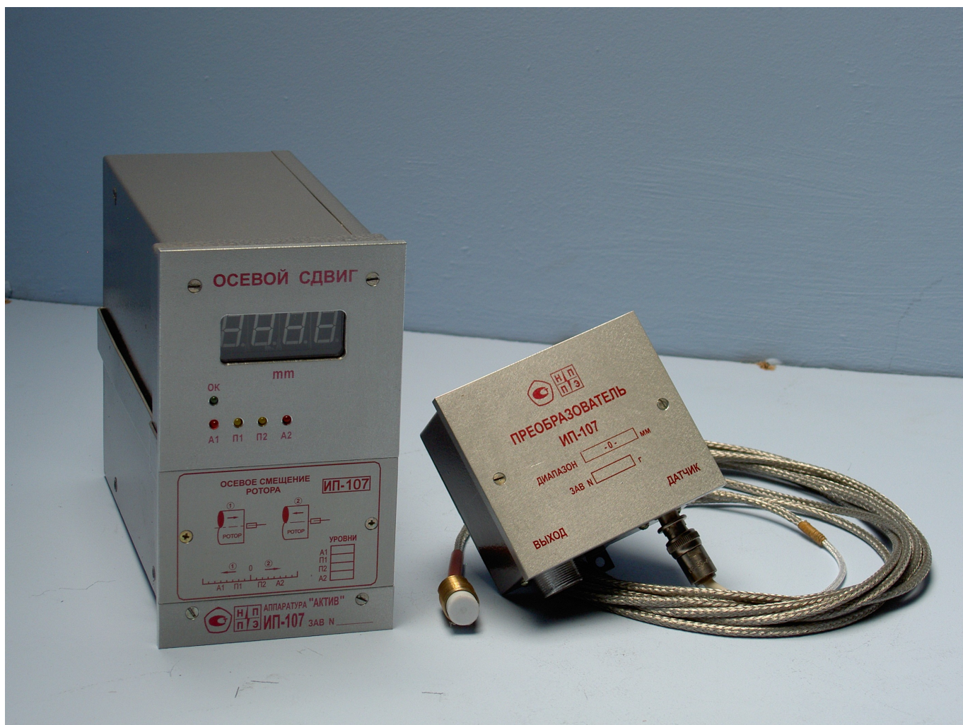
Внешний вид устройства ИП-107.